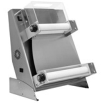
DSA 420-500 RP