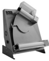
DSA 310-420 TOUCH AND GO